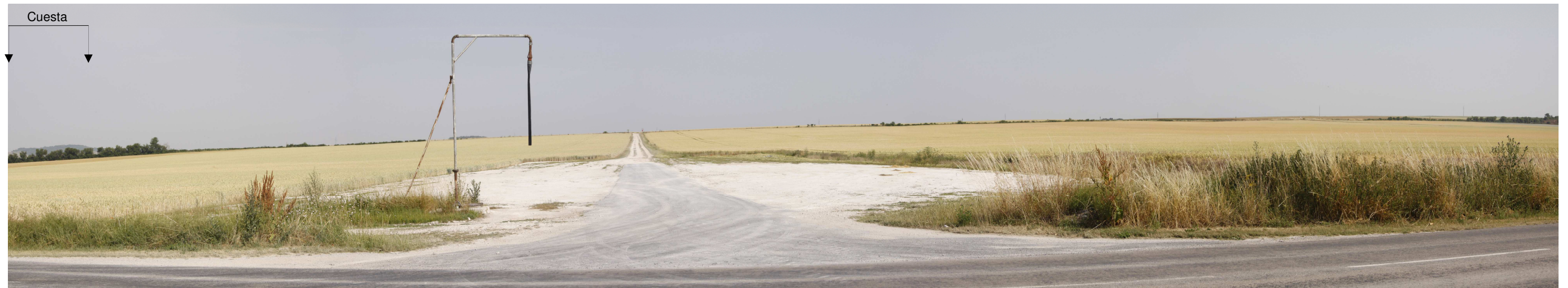
Le site actuel